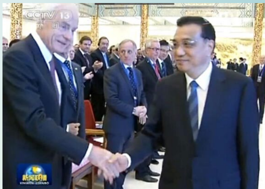
李克强总理与 Intertek 天祥集团首席执行官 Wolfhart Hauser 博士亲切握手

作为最早进入中国的国际第三方质量与安全服务机构，Intertek 天祥集团深刻感受到中国政府对质量的日益重视。“在 Intertek 中国 25 年的检测认证活动中，我们能切身的体会到这种变化，无论是在贸易、民生还是其他方面，政府都施行了许多有力举措，” Wolfhart Hauser 博士说，“Intertek 非常愿意与各方携手迈入中国经济社会发展的‘质量时代’，充分发挥自身国际化和专业经验的优势，与政府和相关组织加强合作，为完善中国质量服务体系献策献力。