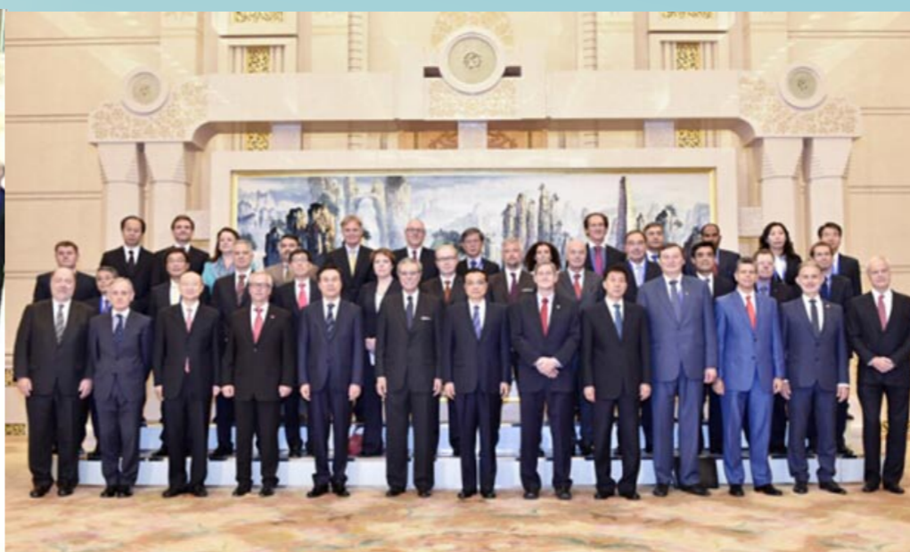
与李克强总理合影（前排右一为 Intertek 天 祥集团首席执行官 Wolfhart Hauser 博士）